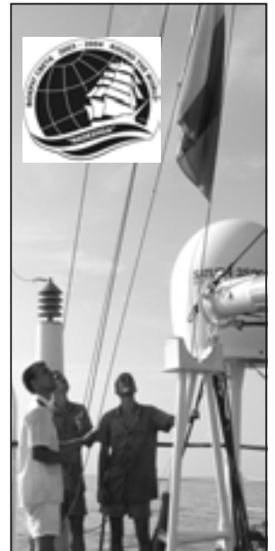
Полюс Государственного флага России.