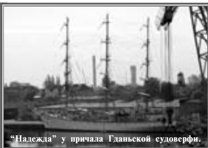
"Надежда" у причала Гданьской судостроительной верфи.

В программе кругосветки "Надежды" был и Гданьск – место рождения нашего парусника. Так случилось, что "Надежда" была там во время майских праздников. И наши ребята увидели, как отмечают День Победы в Польше: ярко, красочно, многолюдно, кстати, не 9 мая, а 8. Кроме этого, курсанты, экипаж и руководители рейса побывали на полуострове Вестерн Пляте, что находится недалеко от Гданьска, и посетили установленный там монумент ста десяти польским героям, отважно державшим оборону гарнизона в начале Второй мировой войны.